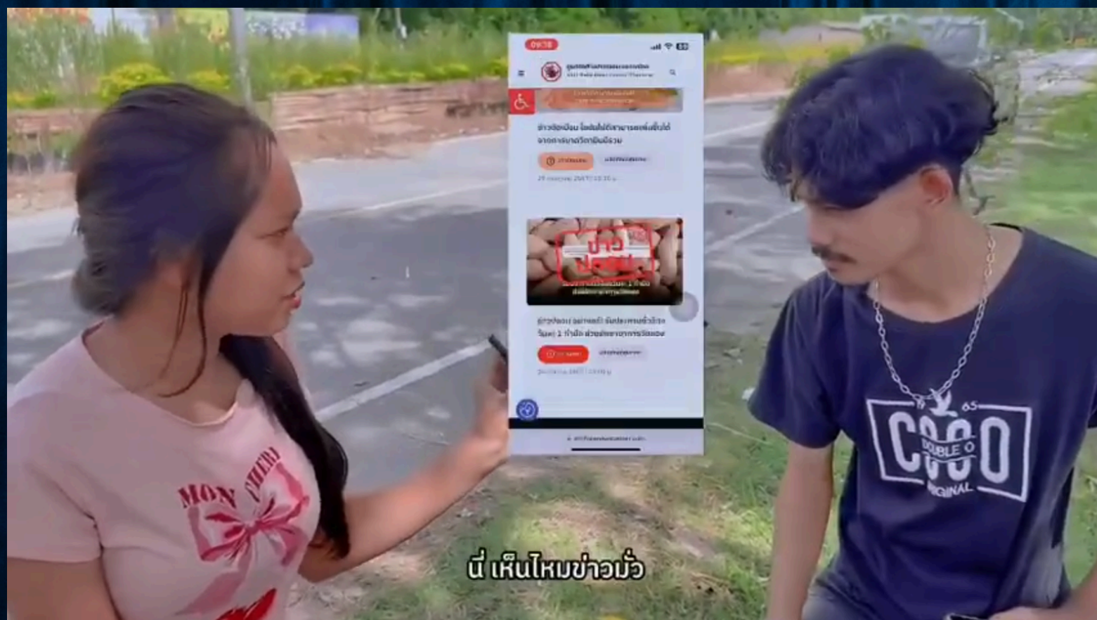
นี่ เห็นไหมข่าวนี้